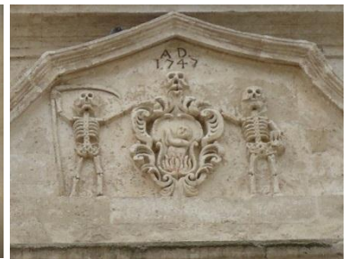
Detail der Chiesa del Diavolo