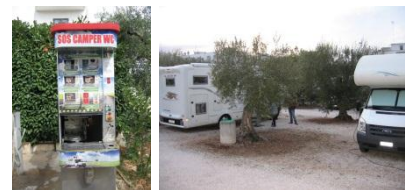
V/E und SP "Nel Verde", Alberobello

Am frühen Nachmittag brechen wir auf zu unserem nächsten Ziel: Alberobello. Am frühen Abend erreichen wir den Stellplatz „Nel Verde“ mit V/E und Strom in bequemer Fussdistanz zum Zentrum mit all den Trullis .